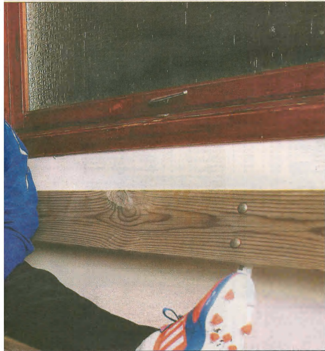
og det heller mot at hun griper den.